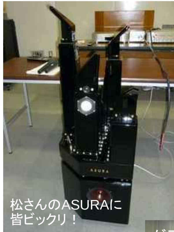
松さんのASURAに 皆ビックリ！